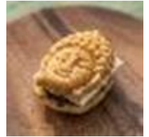
「あみにょん」 酪農王国(株) (R4)