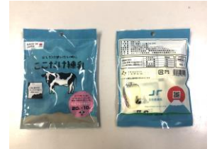
海外用「ここだけ練乳」